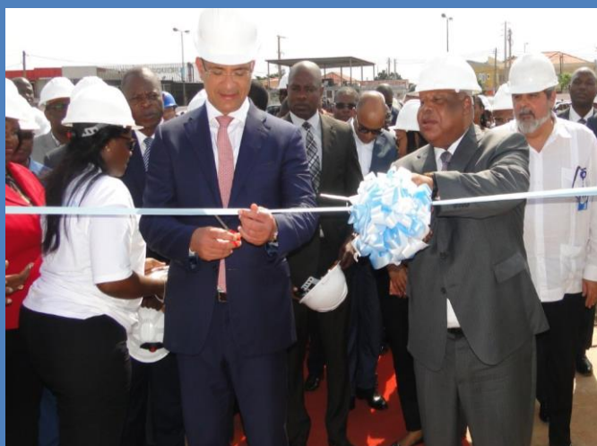
O Governador da Província de Luanda e MINEA inauguram a subestação do Morro Bento com o corte da fita

Alusivo aos 441 anos da cidade de Luanda, que se comemorou no passado dia 25 de Janeiro de 2017, foram inauguradas 3 novas infra-estruturas eléctricas nomeadamente, Subestação do Morro Bento, Morro da Luz e Boavista.