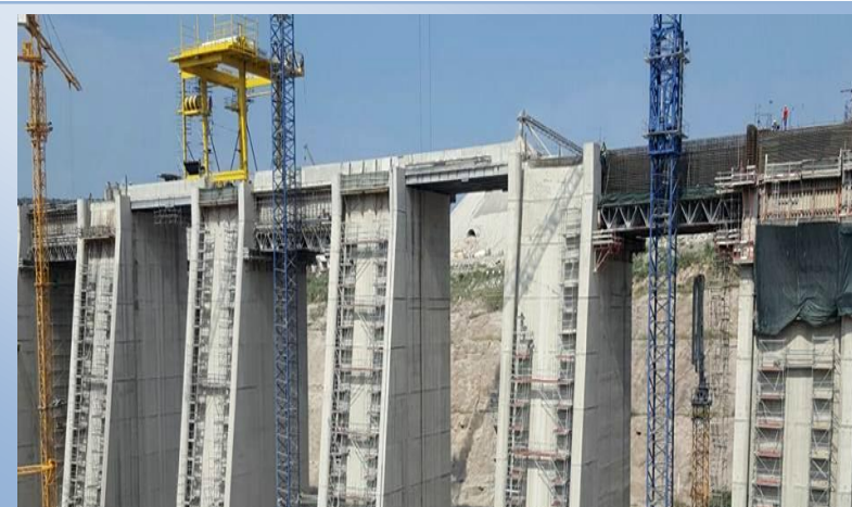
Aproveitamento Hidroeléctrico de Laúca estado actual.