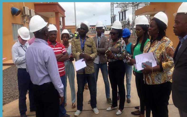
Visita dos jornalistas e fazedores de opinião as novas infra-estruturas eléctricas (Subestação do Morro Bento e Morro da Luz).

Realizado no dia 17 de Janeiro do ano corrente em Luanda, uma visita guiada pelos responsáveis do Governo de Luanda, jornalista de distintos órgãos, fazedores de opinião da redes sociais e municipais para constatar as novas infra-estruturas erguidas, com o objectivo de municiar conhecimentos sobre as infra-estruturas, tendo em conta o grande esforço que o Executivo angolano vem realizando, as infra-estruturas fazem parte de um esforço do Executivo liderado por Sua Excelência Eng. José Eduardo dos Santos, no sentido de reduzir e eliminar o deficit energético do país.