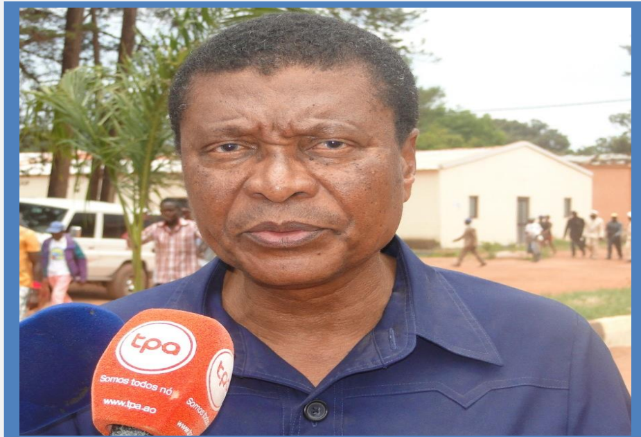
A População do município de Cassongue, testemunharam o lançamento da primeira pedra.