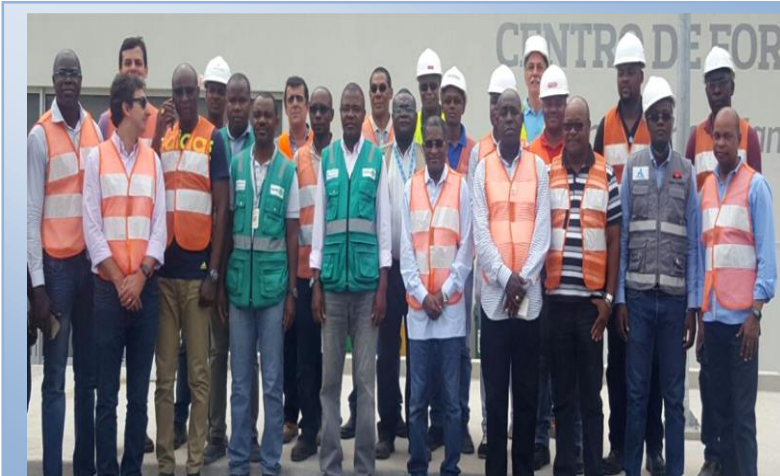
SEE, e parte integrante da comissão atenta a explicação do responsável da obra, foto de família no AHE Laúca.