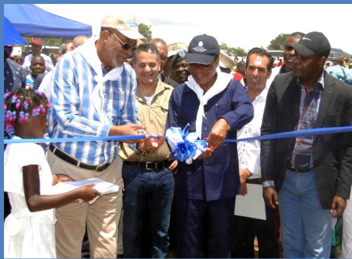
Governador da Província do Cuanza Sul e SEA inauguram o projecto de Construção do Sistema de Abastecimento de água com o corte da fita.

O Secretário de Estado das Águas, procedeu no dia 23 de Janeiro de 2017, no Município de Cassongue, província do Cuanza Sul, sob égide do Ministério da Energia e Águas e do Governo Provincial do Cuanza Sul, a cerimónia de lançamento da Primeira Pedra do projecto de Construção do Sistema de Abastecimento de água naquela região.